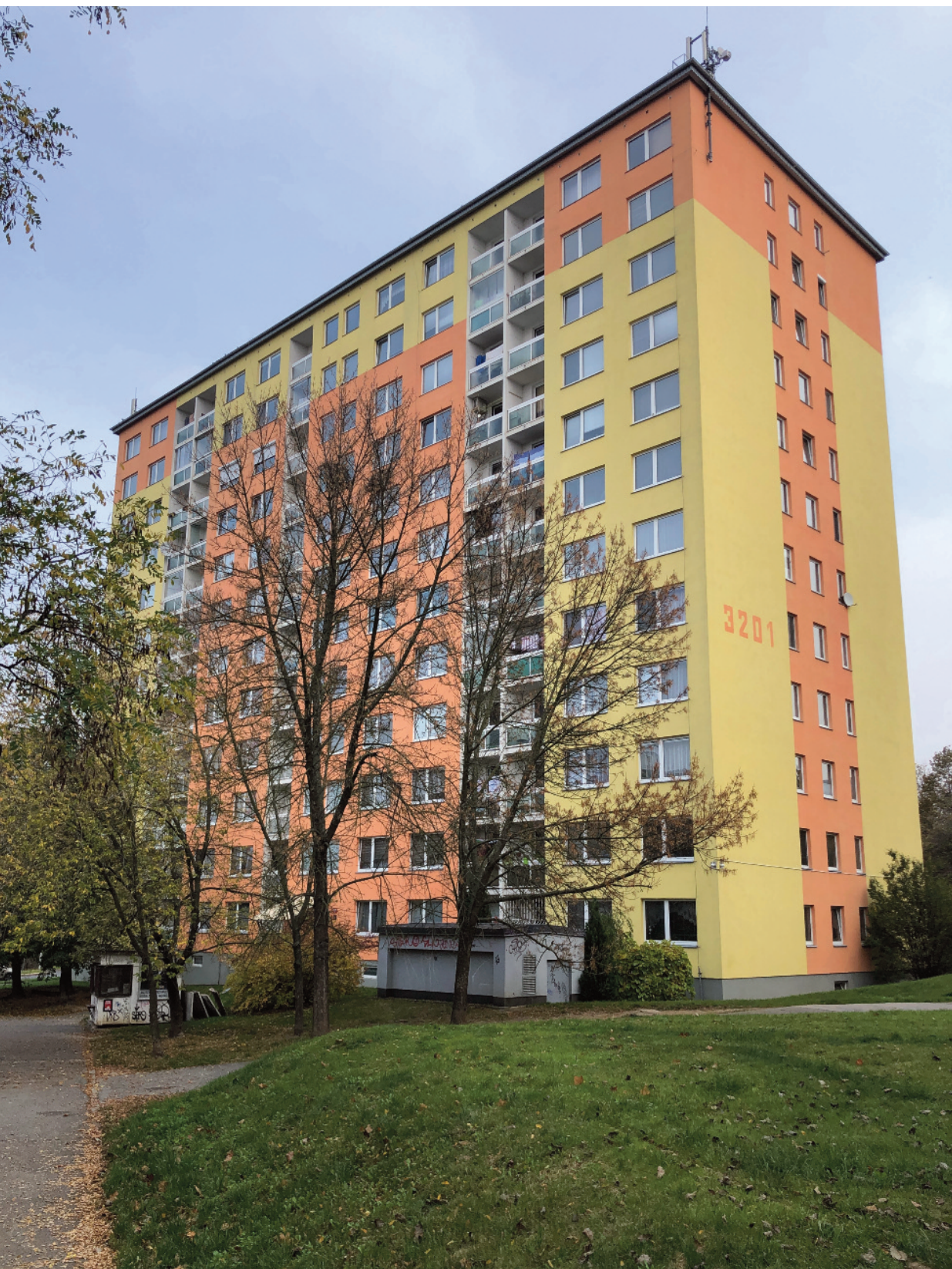
Situace západní pohled současný ...