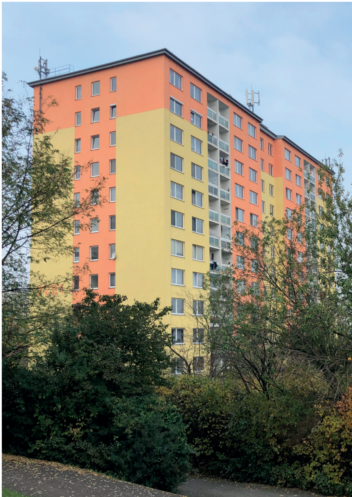
Situace východní pohled současný ...