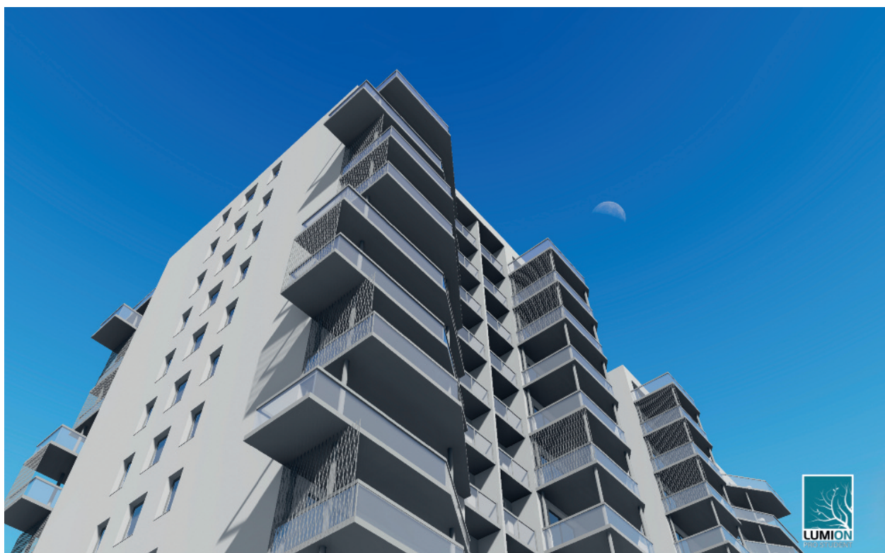
Situace pohled západní