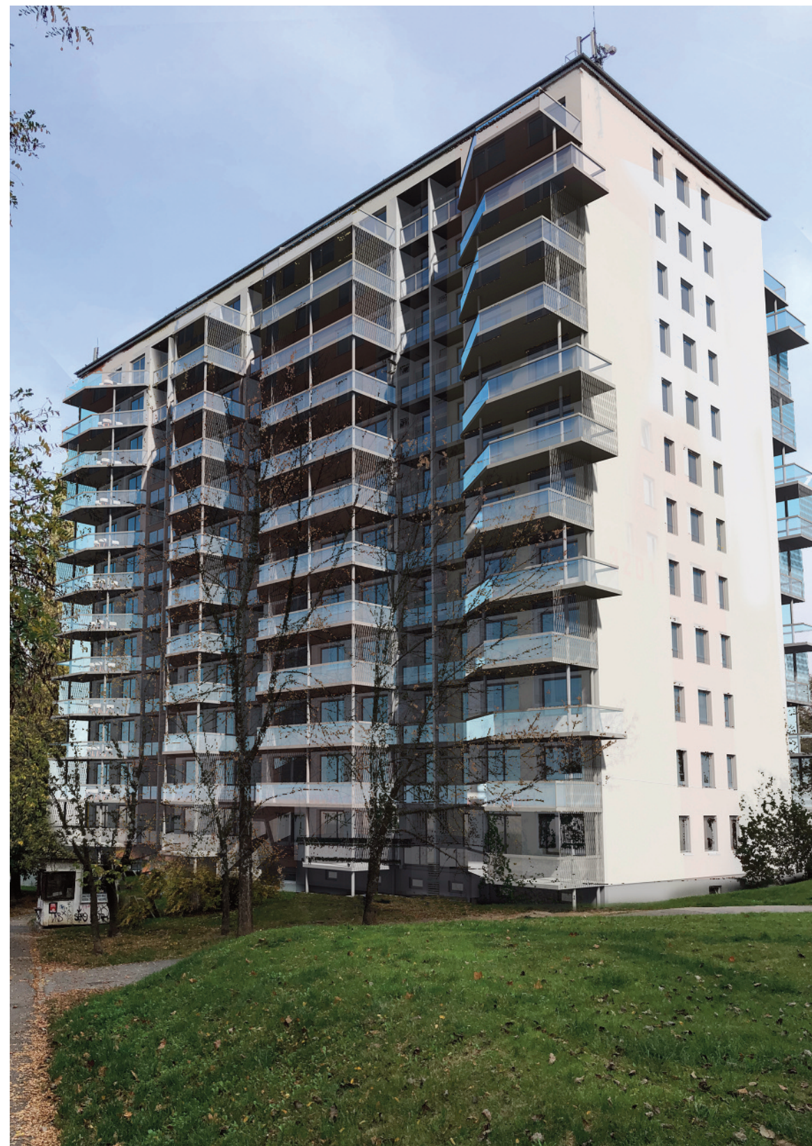
... a po výstavbě