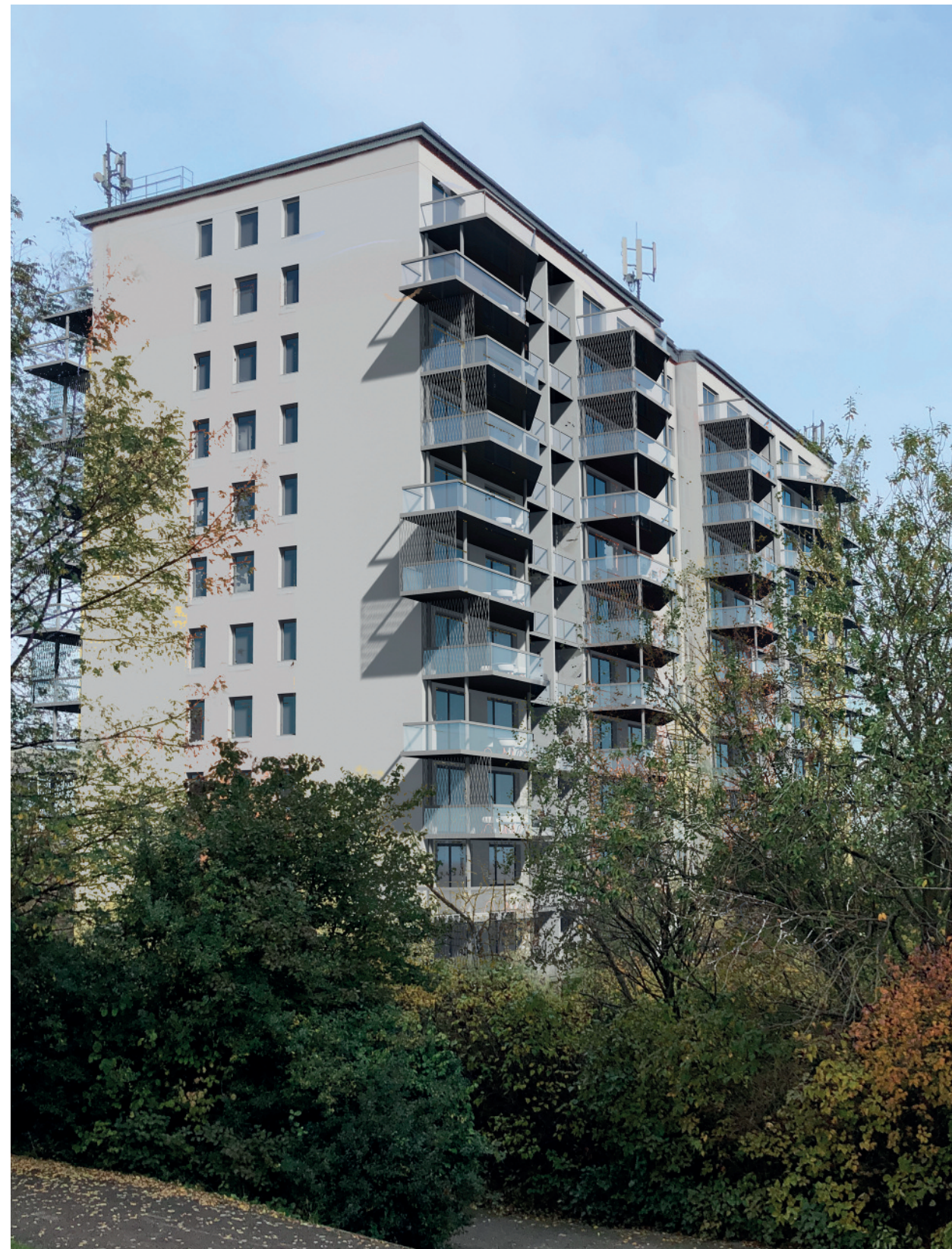
... a po výstavbě